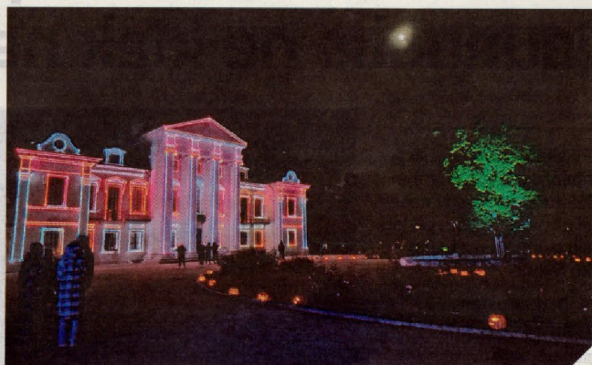
▲ Įvairiaspalvės lazerių kompozicijos dvaro rūmus apšviestas dvaro skirtingomis spalvomis.

Tradicinei moliūgų žibintų šventei buvo pradėta ruoštis prieš kelias savaites. Savo feisbuko paskyroje organizatoriai prašė visuomenės paaukoti šių daržovių. Įmonė „Jorus“ jau kelinti metai renginiui padovanoja daugiausiai – ne vieną šimtą – moliūgų. Tačiau ne ką mažiau suvežė ir pavieniai asmenys. Organizatoriai prognozavo, kad šiemet dvaro teritorijoje sutvirk per 1