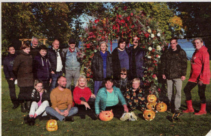
▲ Suvalkijos (Sūduvos) kultūros centro-muziejaus kolektyvas renginiui ruošėsi keletą savaitių.

Šis šešerius metus organizuojamas renginys visuomet vykdavo paskutinėmis spalio dienomis, tačiau šiemet nuspręsta jį šiek