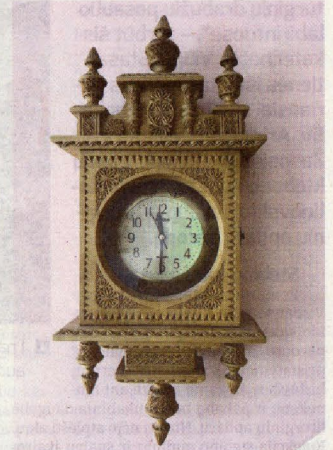
▲ Sudėtingiausias menininko dirbiny – ornamentais išpuoštas sieninis laikrodis.

Prieš kurį laiką įkvėptas žmonos menininkas pradėjo drožinėti miniatiūrinius senuosius kaimo žmonių darbo įrankius, rakandus, įvairius buitines elementus. Prieš pradėdamas juos kurti tautodailininkas nė kiek negalvojo apie savo darbų parodą, tačiau šią mintį subrandino pažintis su Suvalkijos (Suduvos) kultūros centre-muzie-