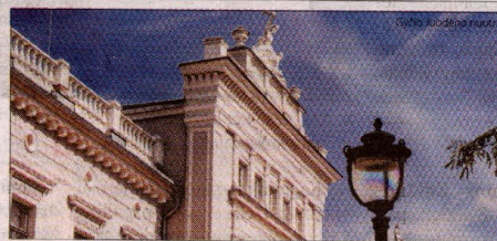
Gylio Juodeno nuotr.

Trakų Vokės dvaras įsikūręs vietoje, apie kurią iki šiol prisimenamos itin senos legendos. Dar XIV amžiuje, kai pro čia žygiavo kryžiuočių kariai, buvo pasakojama, kad šiose apylinkėse vyrus vilioja ir giriose klaidina gražuolės seserys - laumės, vadintos Vokės vardais. 1375 m. Vokės vardas pirmą kartą paminėtas istoriniuose šaltiniuose.